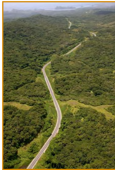
新的環島公路已在2008年完成